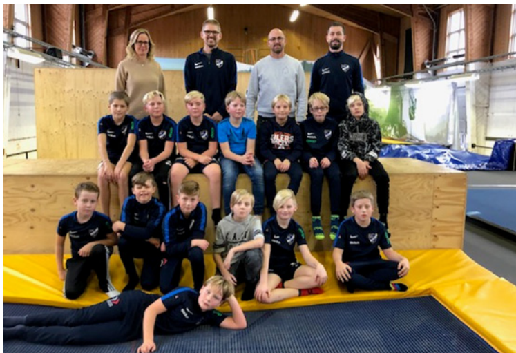
På bilden: Gänget som deltog på lagaktiviteten på Snow Camp i november.